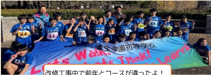
改修工事中で前年とコースが違ったよ!

12月14日(土) 秋留台公園にて 3年生～6年生の選抜者33名が駅伝大会に参加しました。