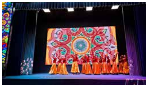
生徒の歌やダンスで歓迎を受ける