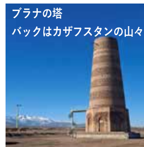
ブラナの塔 バックはカザフスタンの山々

菅生学園では、様々な国々との交流を重ねてきています。これまで、オーストラリア、アメリカ、カナダ、ヨーロッパの国々との交流を行っていますが、これからは、アジアの国々との関係構築も重要です。本年度より特進PBLコースはインドネシアバリ島、医学難関コースはマレーシアクアラルンプールを訪問しています。菅生学園では、教育活動を通じて、こうした国々の皆さんと交流を大事にしつつ、平和で友好的な国際社会を希求していきたいと思っています。