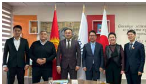
キルギス大統領府附属学校を訪問