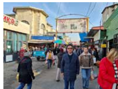
中央アジア最大級の市場オシュバザール