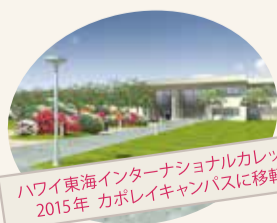
ハワイ東海インターナショナルカレッジ 2015年 カボレイキャンパスに移転